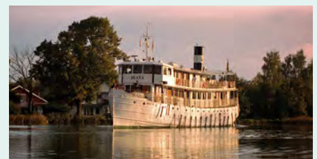
Sie fahren mit der MS Diana. Details finden Sie auf Seite 129.

„Als Bordlektüre empfehle ich die Kommissar Beck-Krimis. Schauplatz des ersten Falls ist Ihr Schiff – die MS Diana.“